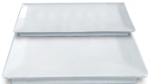
PIATTO QUADRO SUSHI Sushi Square Plate