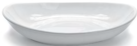
PIATTO FONDO OVALE Oval Deep Plate

HANDPAINTED LINE IT'S A TRIBUTE TO THE ITALIAN ART. EVERY PIECES IS UNIQUE AND UNREPEATABLE, THE PROTAGONIST IS THE COLOR, RIGOROUSLY HANDPAINTED.