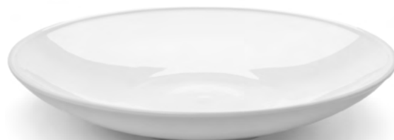
PIATTO TONDO COUP Coup Round Plate