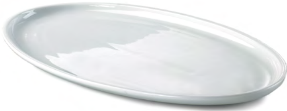
PIATTO OVALE Oval Plate