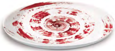
Disegno A / Drawing A

Disegni disponibili e riproducibili in tutte le forme indicate / Drawings available for every item of this collection