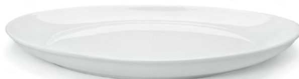
PIATTO OVALE Oval Plate