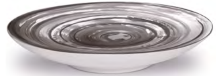
Disegno C / Drawing C