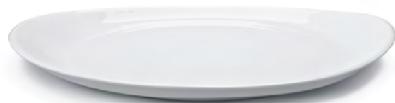
PIATTO BISTECCA Steak Plate