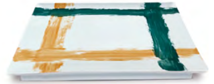
Disegno F / Drawing F