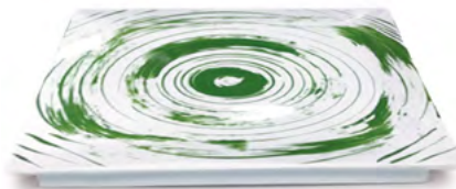
Disegno E / Drawing E